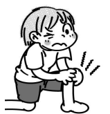
ひざの関節に痛みや動きの悪いところがある