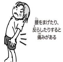
腰をまげたり、反らしたりすると痛みがある