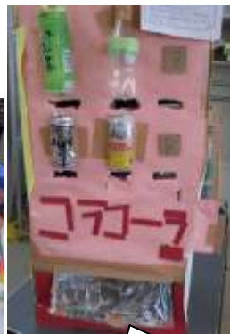
自動販売機! 実際に出ています

学級で選ばれた作品が図工室に展示されました。身の回りの材料を生かした工作や、紙粘土や木を使った作品、手芸、また、テーマを決めて調べた結果をまとめたものなど、アイデアいっぱいの作品ばかりでした。休み時間には、たくさんの子もたちが訪れ、熱心に眺めていました。特に、作品にさわって遊べるコーナーは大人気です。ビー玉を穴に落とさないようにゴールまで転がすゲームや的当て、物が逆さまに見える望遠鏡は大人気で、たくさんの子も達が順番待ちをして遊んでいました。また、各教室や廊下に展示された作品も力作揃いでした。ご家庭でのご支援ご協力、ありがとうございました。